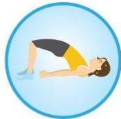
Pod pe spate