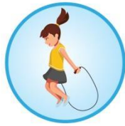
Sărit cu coarda