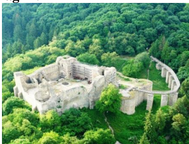
Sursa 2: Cetatea Neamțului