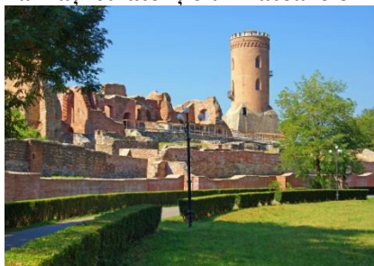
Sursa 1: Cetatea Târgoviștei

1. Analizați cu atenție următoarele imagini: