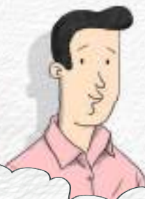
TATA MARELE NAIV