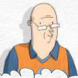
BUNICUL CEL GREU DE PĂCĂLIT