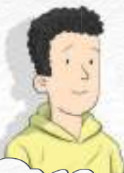
MAX POWER SURFER-UL