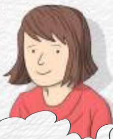
MAMA CEA DRĂGĂSTOASĂ